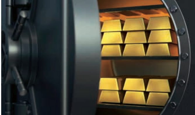
HOCHSICHERHEITSTRESOR: Das Gold der Sparer ist gut versorgt