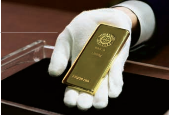
GOLDBARRENKAUF: Die Lagerung des Kleinods sollte bedacht werden

Um die Seriosität der Sparplan anbietenden Edelmetallhändler zu beurteilen, wurden in den Fragenkatalog auch entsprechende Kriterien aufgenommen. Wichtig ist dabei, ob der Edelmetallhändler Mitglied des Berufsverbands des Deutschen Münzenfachhandels e. V. ist, ob schon Jahresabschlüsse im Bundesanzeiger veröffentlicht wurden und wie lange bereits Sparpläne angeboten werden.